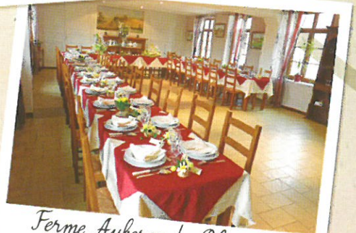
Ferme Auberge du Blaisel Restaurateur 2