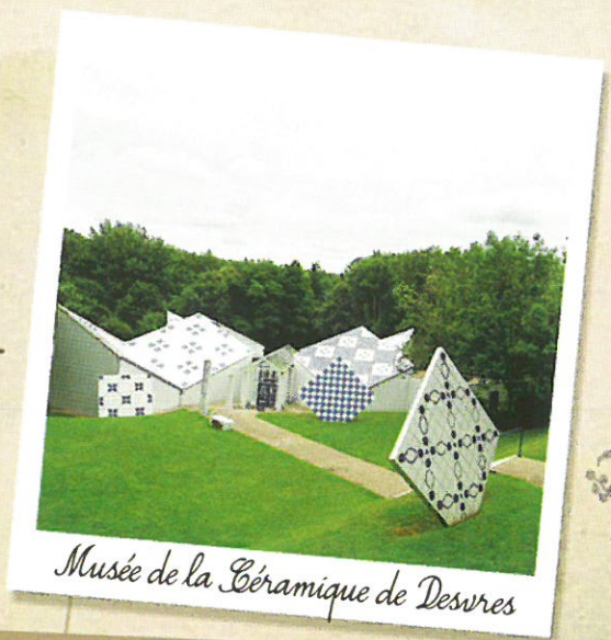
Musée de la Céramique de Desvres

Une scénographie étonnante, des collections spectaculaires, des jeux et des outils technologiques vous attendent pour une immersion dans la passionnante histoire de la céramique du Nord ! Admirez plus de 600 pièces et découvrez à travers un parcours interactif tout le savoir-faire des faïenciers. www.musee-ceramique-desvres.com