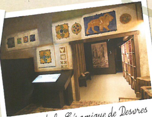
Musée de la Céramique de Desvres Visite 2 : 4€