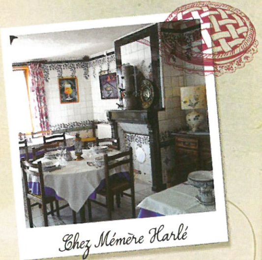
Chez Mémère Harlé

Vos papilles seront séduites par les saveurs et les odeurs de la cuisine de notre restaurant qui est décoré de faïence de Desvres. Un grand four au bois nous permet de cuire la Tarte Papin et les spécialités maison depuis 1919. Tél : 03 21 87 34 87