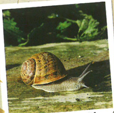
L'Escargotière du Choquel

L'Escargotière du Choquel vous fait découvrir son élevage et vous propose une dégustation de produits à base d'escargots. Un moment agréable et convivial pour découvrir de nouvelles saveurs. www.lescargotiere.com