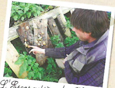
L'Escargotière du Choquel Visite 3 : 4€