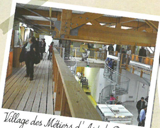
Village des Métiers d'Art de Desvres Visite 1 : 5€